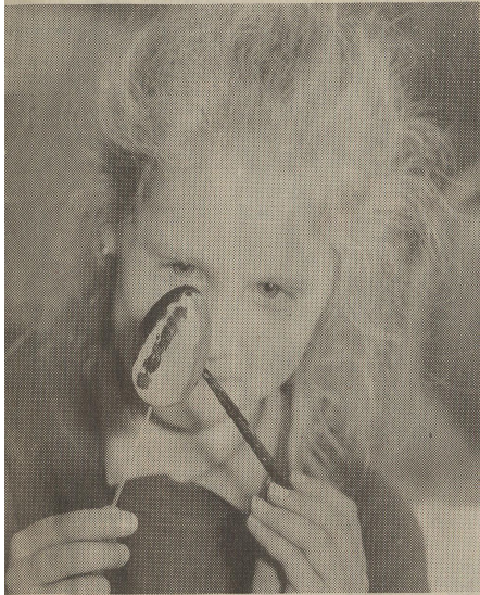
Mit viel Sorgfalt bemalten die Kinder im Jugendheim Leybankstraße ihre Holzeier.