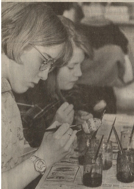
Especially kunstvoll fielen die Gemälde der Größeren aus. Mehr als eine Viertelstunde brauchten aber auch sie nicht für ihre Ar-

„Das Backen war schon im letzten Jahr die große Attraktion“, so Freyemann. Die Backaktion beginnt um 11 Uhr für Kinder ab sechs Jahre. Anmeldung unter ☎ 43 34 86. jasi